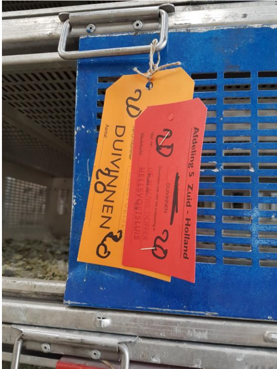
DUBBELE LABELS BIJ RESTMANDEN

Restmanden moeten aan voor- en achterzijde een restlabel hebben, waarop het juiste aantal duiven staat vermeld. Ook moet de restmand aan de achterzijde de label van de losgroep hebben, zodat het voor iedereen duidelijk is om welke losgroep het gaat.