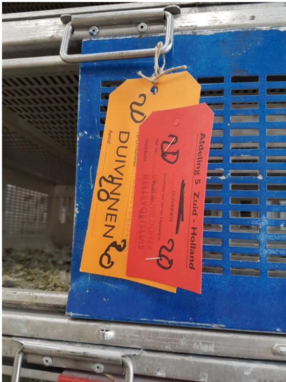
DUBBELE LABELS BIJ RESTMANDEN

Restmanden moeten aan voor- en achterzijde een restlabel hebben, waarop het juiste aantal duiven staat vermeld. Ook moet de restmand aan de achterzijde de label van de losgroep hebben, zodat het voor iedereen duidelijk is om welke losgroep het gaat.