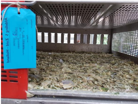
TE VEEL HOUTMOT