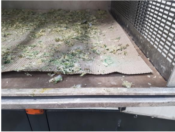
TE WEINIG KARTON